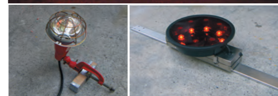
ジャンボコーン内部設置型