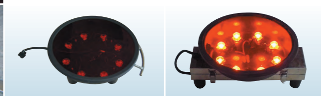
本体・電池ボックス分離型